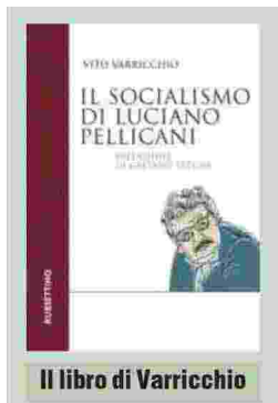
Il libro di Varricchio