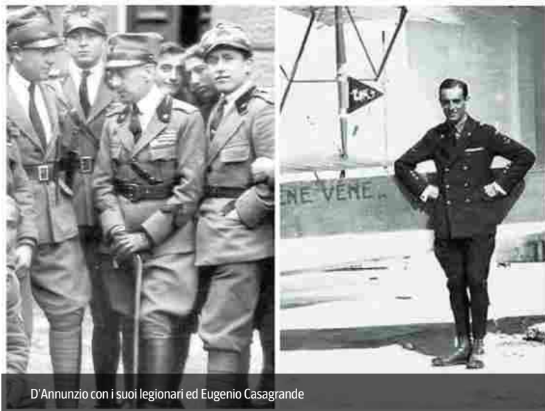
D'Annunzio con i suoi legionari ed Eugenio Casagrande

La complessa vicenda fiumana viene ricostruita «dall'interno» con la pubblicazione delle lettere personali di Ninetta Cais di Pierlas Mocenigo - nobildonna veneziana - e di suo marito, Eugenio Casagrande - coraggioso aviatore della Grande guerra - che seguirono D'Annunzio a Fiume. L'occupazione della città iniziò il 12 settembre 1919 e durò 16 mesi con vicende che videro i due protagonisti.