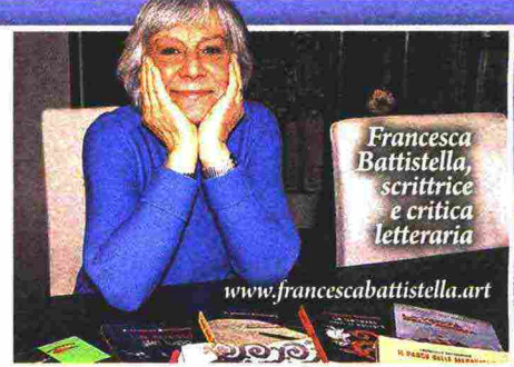
Francesca Battistella, scrittrice e critica letteraria