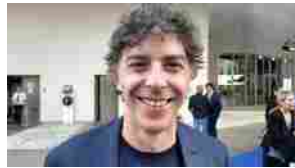
Nastri d'Argento 2024, le voci dei protagonisti e dei premiati dal blu carpet a Roma