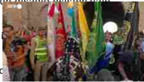
Marocco, a Essaouira i colori della 25esima edizione del Festival Gnaoua