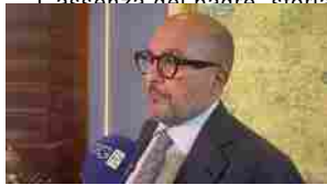
Sgarbi: "Muti che dirige concerto-evento Puccini e' magico"

L'assenza del padre, storia di un disagio esistenziale