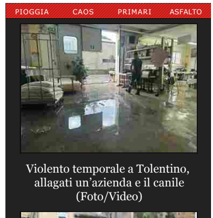
Violento temporale a Tolentino, allagati un’azienda e il canile (Foto/Video)

Ritaglio stampa ad uso esclusivo del destinatario, non riproducibile.